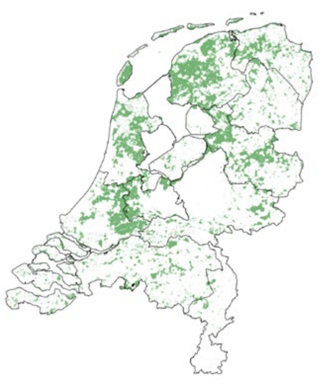
Gebieden waar relatief veel weidevogels leven, waarbinnen de kansgebieden gezocht worden.

Om de grutto te redden zijn optimale inrichting en beheer vereist in speciaal aan te wijzen kansrijke gebieden voor weidevogels. Deze gebieden zijn van voldoende omvang om te kunnen fungeren als brongebied voor het herstel van de populaties grutto's en andere weidevogels. De kansgebieden liggen in laag-Nederland, in de weidevogelprovincies: Friesland, Noord Holland, Zuid Holland, Utrecht, Groningen en Overijssel. Provincies selecteren de kansgebieden samen met boeren, natuurorganisaties en betrokken vrijwilligers.